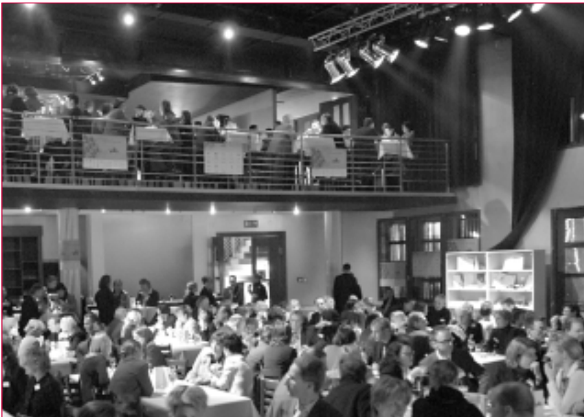
Gäste der Preisverleihung im Palais der KulturBrauerei in Berlin

Mit dem Preisverleihungsevent am 22. Januar in Berlin vermittelte sich den rund 280 Gästen und insbesondere den Wettbewerbsfinalisten schon ein wenig oscar-verdächtige Atmosphäre.