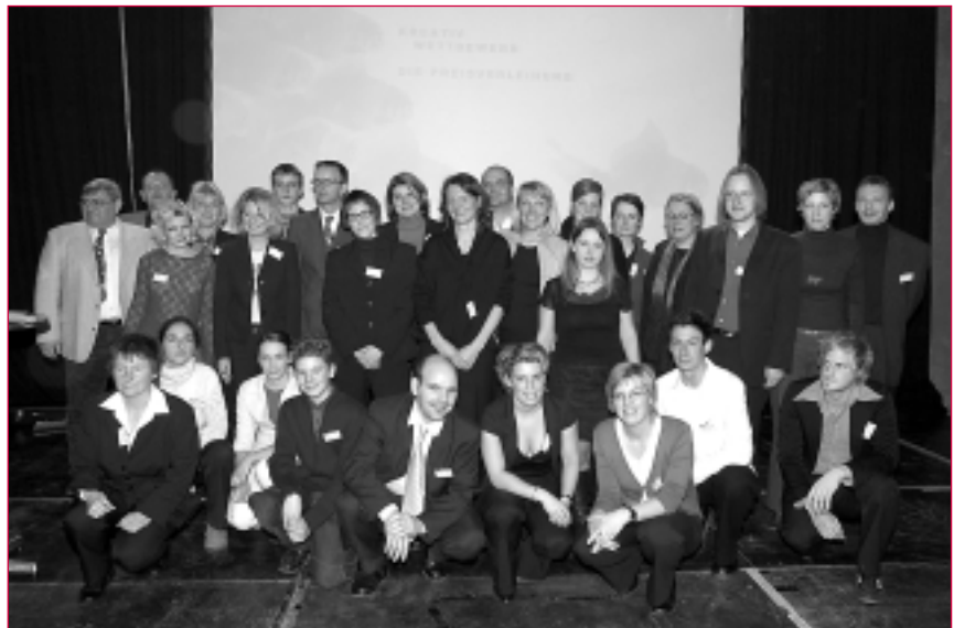
Die Finalisten des Wettbewerbs

Alle Preise wurden von Unternehmen zur Verfügung gestellt, denen an dieser Stelle nochmals ein herzliches Dankeschön für ihre aktive und freundliche Unterstützung gilt.