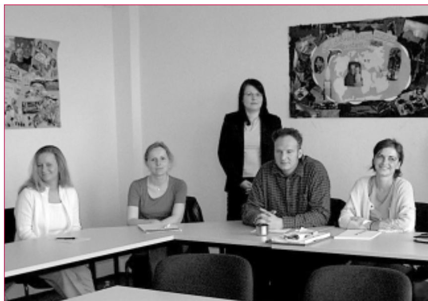
"Trainees für Berlin" im Mai 2003