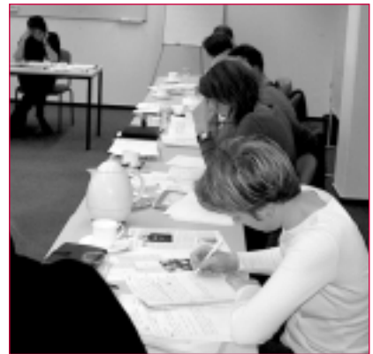
Workshop-Teilnehmer bei "Schreibübungen"

Am Ende des Workshops saßen die Haare zwar immer noch nicht besser, aber es hatten sich eine Menge kreativer Impulse und ein beachtlicher Schreibfluss eingestellt.