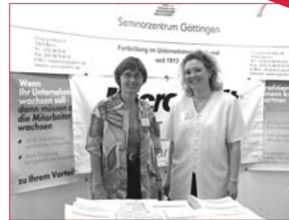
Seminarzentrum Göttingen "to be met" auf der Berliner Bildungsmesse

Mit der 32. Bildungsmesse verabschiedet sich der Veranstalter vom Haus am Kölnischen Park, wo die Messe seit 1991 ihre Heimat hatte. Im