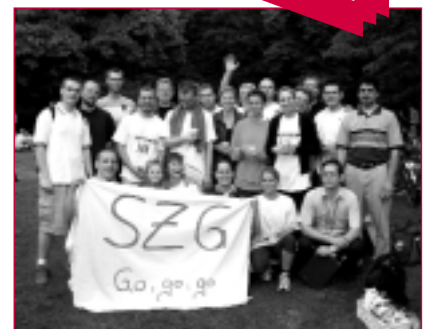
Berliner Mitarbeiterteam von Seminarzentrum Göttingen bei der Staffel 2002

Viele Teamkollegen von Seminarzentrum Göttingen waren an die Strecke gekommen und haben den Aktiven Mut gemacht und Unterstützung gegeben – mit Begeisterung, Anfeuerungsrufen und einem Transparent: "SZG go, go, go!" Eine schöne Aufforderung, sich neben den Teamleistungen im Job auch weiterhin im