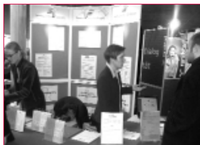
Seminarzentrum Göttingen "to be met" auf der Praxisbörse

Am 14. November 2002 findet bereits zum sechsten Mal die Praxisbörse an der Georg-August-Universität Göttingen statt. Die Berufsinformations- und Hochschulkontaktmesse soll interessierten Besuchern, vom Studienanfänger bis zum Hochschulabsolventen, ein Forum bieten, um mit Vertretern der unterschiedlichsten Berufsfelder Kontakt aufzunehmen.